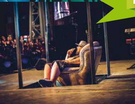
Quand l'équipe technique de Claudio Capéo fait joujou avec l'ascenseur de scène !