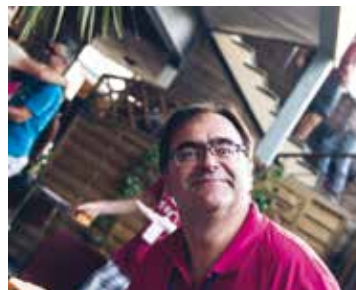
11 soirées complètes : un trésorier qui sourit est un trésorier heureux !