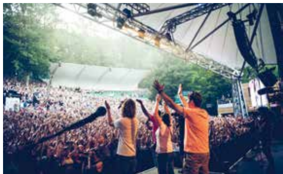
Clap public géant pour l'émission d'Hit West en direct de Poupet.