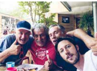
Visite surprise du festival « Pause Guitare » d'Albi.