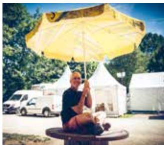
Une première année à Poupet, ça mérite un bizutage !