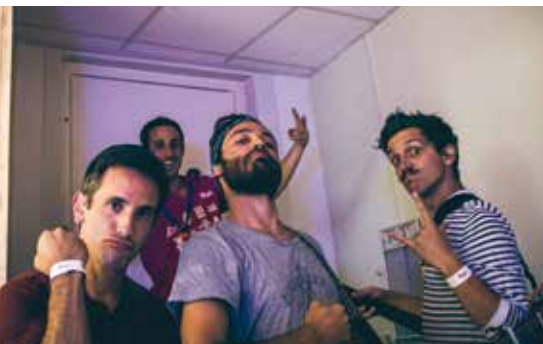
Les Trottoirs d'en Face juste avant leur entrée sur scène par l'ascenseur.