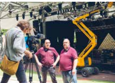
L'équipe Sécu en interview