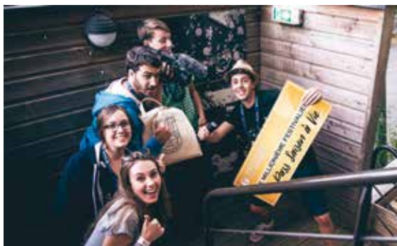
C'est parti pour le grand concours 2017 ; un pass à vie pour le millionième festivalier !