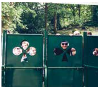
Les premiers festivaliers 2017, arrivés tôt hier après-midi.