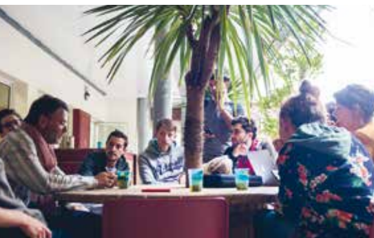
Le Pôle Média en grande réunion de lancement de saison