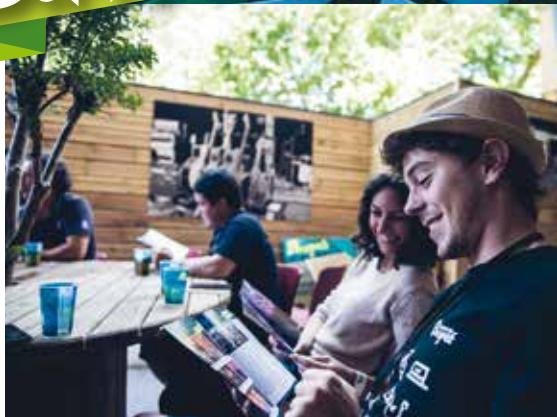
Première soirée hier, premier Live Mag !