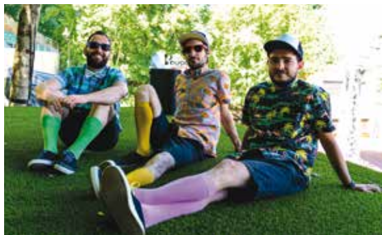
Les Chansons d'Occasion, trublions de service et locaux de l'étape hier soir.