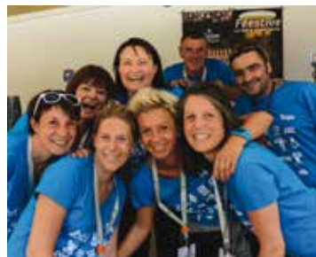
L'équipe des bars prête à faire feu !