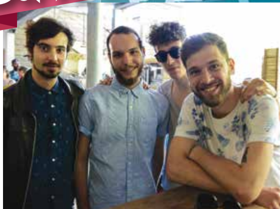
Les Lyonnais de Yeast, gagnants du tremplin Poupet, hier soir sur la grande scène de Poupet.