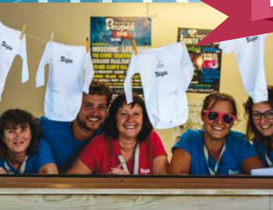
Des bodies aux couleurs de Poupet pour les tout petits à venir très prochainement au sein de l'équipe du Festival.