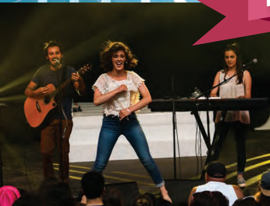
Les Rêveurs de Lune, enfants du pays, dimanche sur la grande scène de Poupet pour la première partie de Louane.