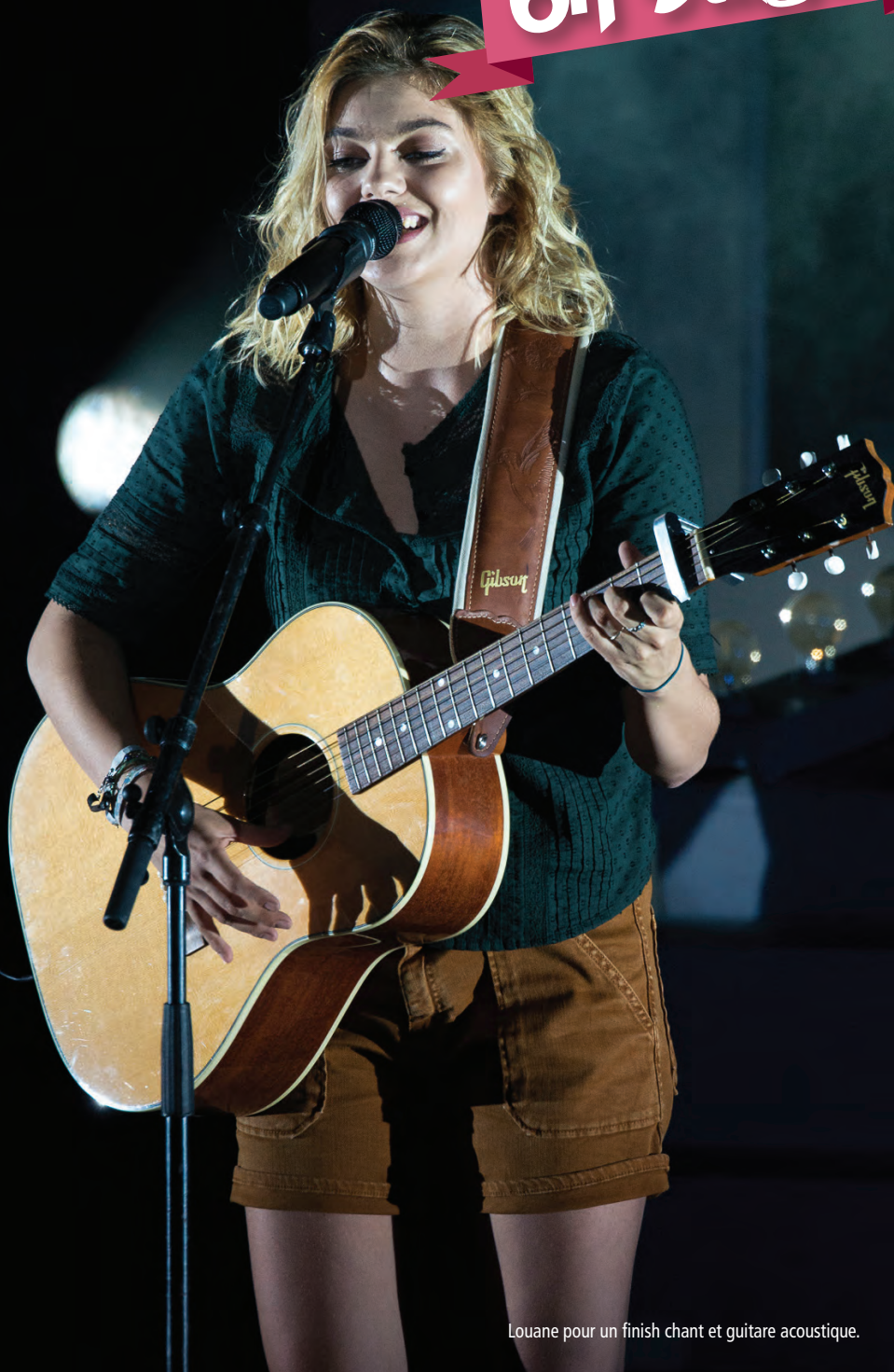
Louane pour un finish chant et guitare acoustique.