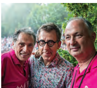
Jamy Gourmaud, l'animateur TV de « C'est pas sorcier » en visiteur surprise du festival.