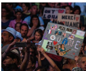
La base fan de Louane a répondu présent !