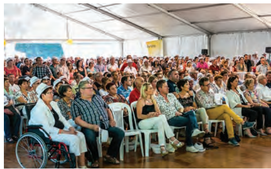
Avec près de 700 invités, la société Orvia avait mis les petits plats dans les grands samedi soir pour fêter comme il se doit son 40 ème anniversaire.