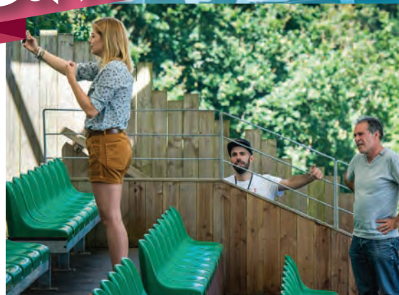
Louane en mode vidéo selfie pour annoncer sur les réseaux sociaux l'avancée de l'heure du concert de dimanche.