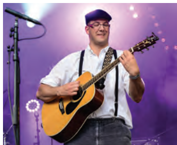
Joyeux Bordel, venus en voisins.