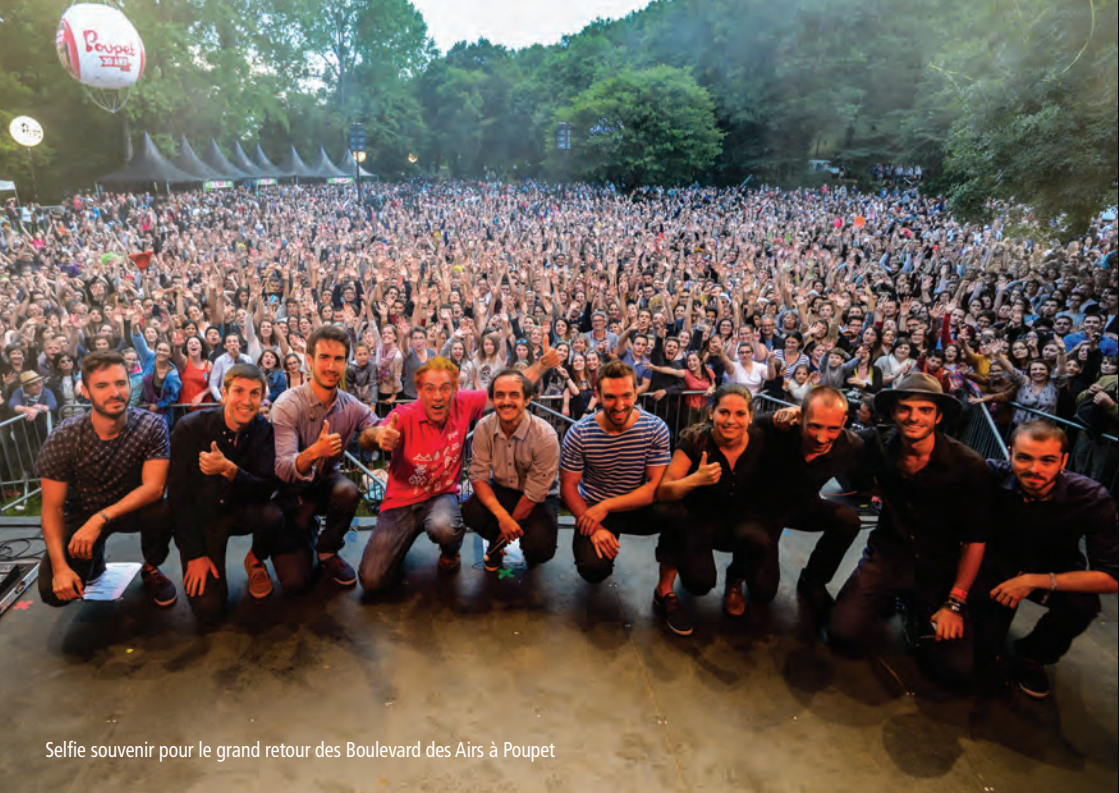
Selfie souvenir pour le grand retour des Boulevard des Airs à Poupet