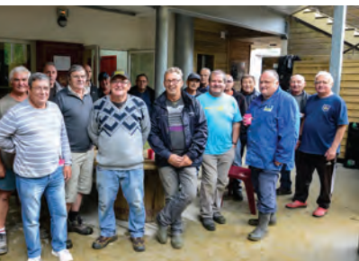
Coup de main des anciens pour le montage des tribunes du spectacle The Balls.