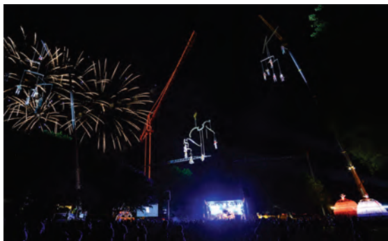
Un finish ébouriffant, avec Transe Express