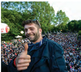
Le grutier en chef depuis sa nacelle : vue imprenable !