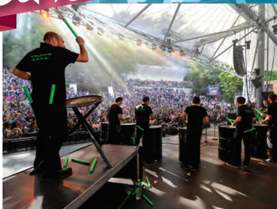
Les Tambours de l'An Fer, la troupe malouine et percutante !